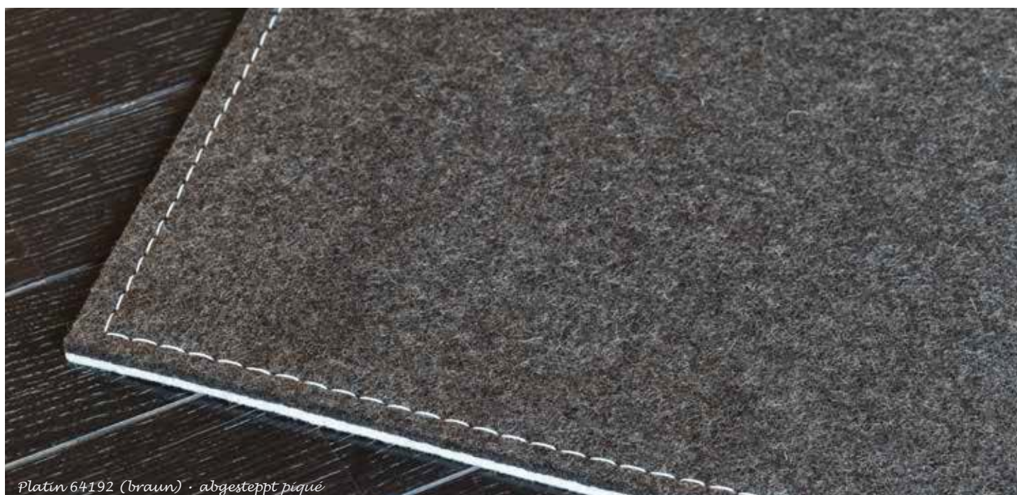
Platin 64192 (braun) · abgesteppt piqué