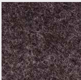
Platin 64192 weiss/braun (braun)