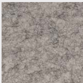
Platin 64192 weiss/braun (weiss)